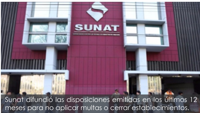
Sunat difundió las disposiciones emitidas en los últimos 12 meses para no aplicar multas o cerrar establecimientos.

La administradora tributaria informó que ya no clausura establecimientos de contribuyentes con Nuevo RUS que no hayan emitido comprobantes de pago.