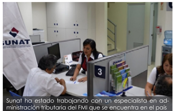
Sunat ha estado trabajando con un especialista en administración tributaria del FMI que se encuentra en el país

El ministro de Economía y Finanzas, Alfredo Thorne, reafirmó que el Gobierno reducirá el IGV, medida que junto con otras 12 medidas más estarán incluidas en el pedido de facultades que harán llegar al Congreso en los próximos días.