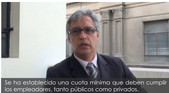
Se ha establecido una cuota mínima que deben cumplir los empleadores, tanto públicos como privados.