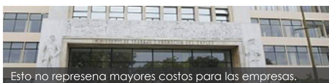
Esto no representa mayores costos para las empresas.

El viceministro de Trabajo, Augusto Eguiguren Praeli, informó que el Ministerio de Trabajo y Promoción del Empleo (MTPE) se alista para la digitalización de los documentos laborales como boletas de pago y la instalación de casillas electrónicas, sin que ello represente mayores costos para las empresas y trabajadores.