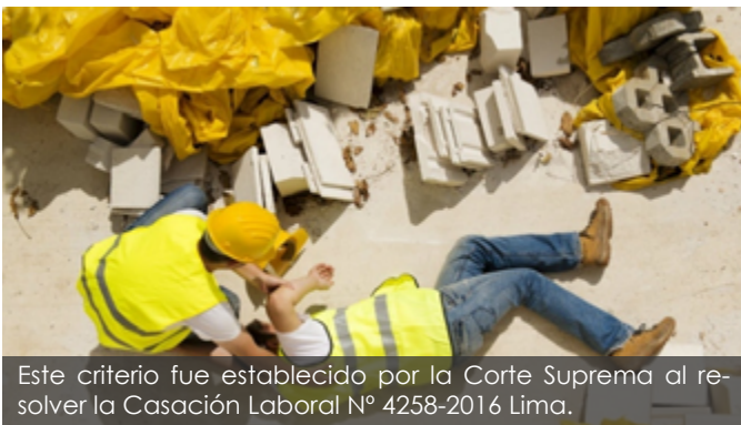
Este criterio fue establecido por la Corte Suprema al resolver la Casación Laboral N° 4258-2016 Lima.

En un reciente fallo, la Corte Suprema ha establecido un precedente vinculante que precisa la correcta interpretación del artículo 53 de la Ley de Seguridad y Salud en el Trabajo: debido al incumplimiento de su deber de prevención, es obligación del empleador indemnizar al trabajador cuando este sufra daños a consecuencia de un accidente de trabajo.