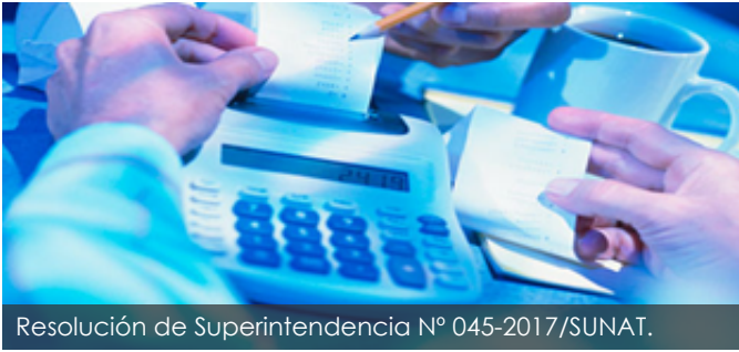
Resolución de Superintendencia N° 045-2017/SUNAT.

Edición Febrero 2017 - Del 20/02/17 hasta el 28/02/17